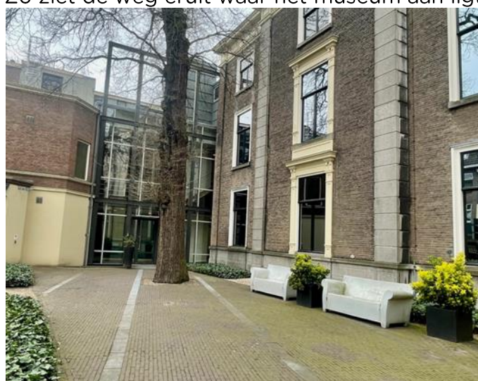
Dit is de hoofdingang vanaf de tuin gezien.