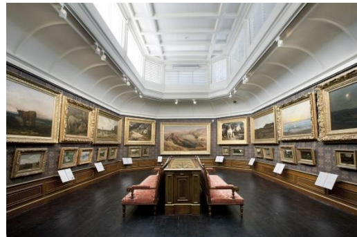
In deze zaal op de tweede verdieping hangen de schilderijen boven elkaar.