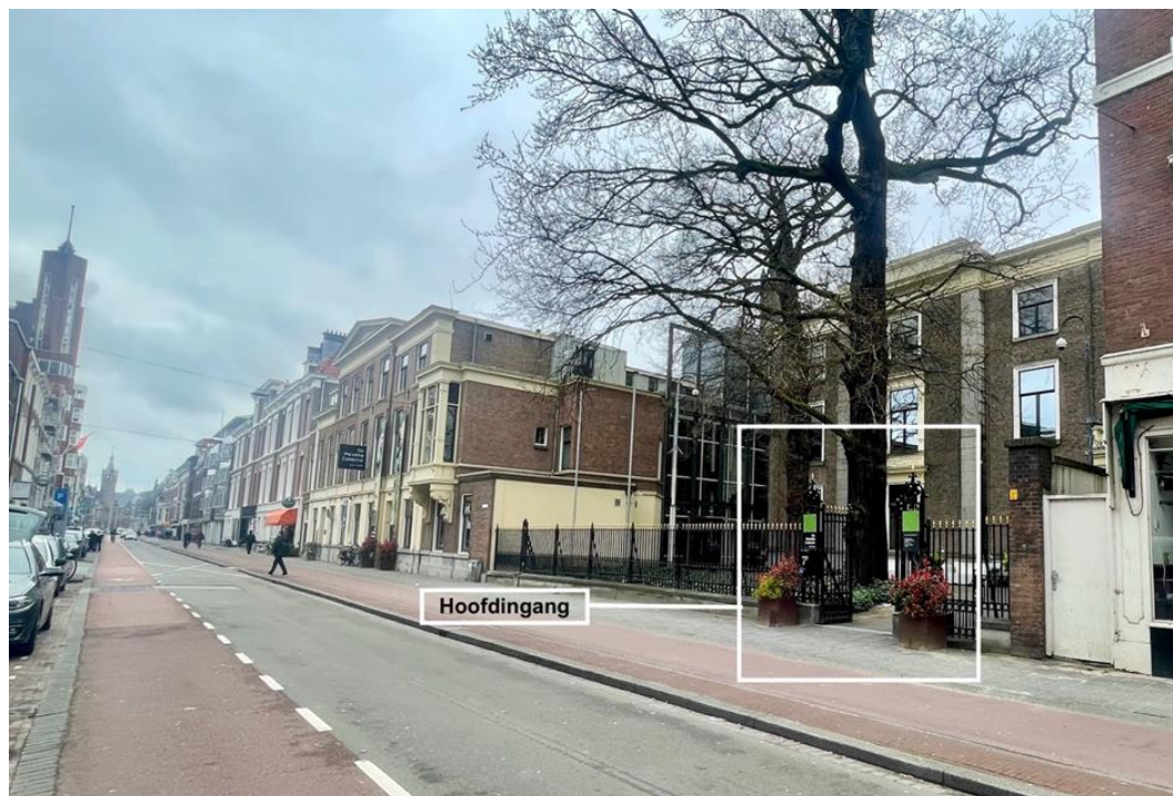
Zo ziet de weg eruit waar het museum aan ligt.