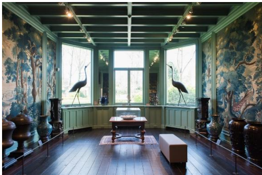
In deze zaal op de begane grond is druk behang te zien.

Het museumgebouw met de vaste collectie heeft aan één kant van het gebouw een trappenhuis. Aan het einde van de eerste en tweede verdieping ga je weer terug naar het trappenhuis om naar boven of weer naar beneden te gaan.