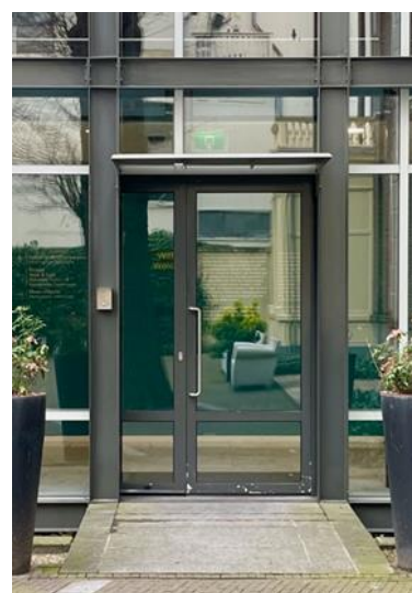
Dit is de entree deur.